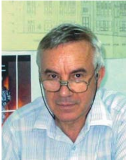
Octav DIMITRIU 1820

Arhitectura gândită cu suflet și pasiune devine un fermecător și trainic amalgam al trioului constructiv ideal: funcționalitate – tehnică – artă.