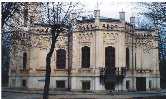
Consolidare, amenajare și restaurare Casa Bosianu - Institutul Astronomic București vedere, plan parter