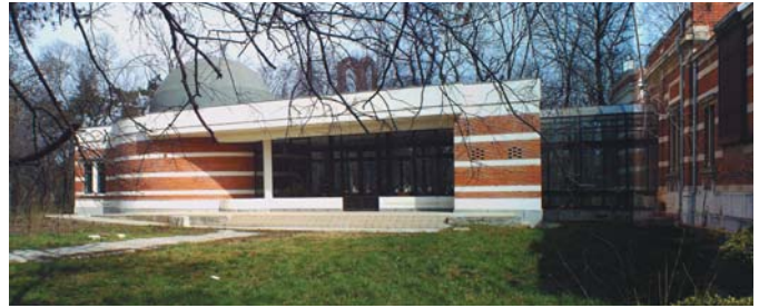
Institutul Astronomic București, Planetariu 60 locuri (corp nou)

Arhitectura gândită cu suflet și pasiune devine un fermecător și trainic amalgam al trioului constructiv ideal: funcționalitate – tehnică – artă.