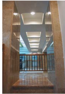
Sediul OSIM, biblioteca, vedere interioară, secțiune