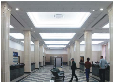
Consolidare, amenajare și restaurare Palatul Telefoanelor, Calea Victoriei vedere holul ghișeelor, plan parter